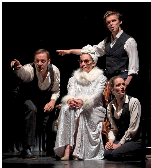
Avignon est tout petit pour ceux qui s'aiment, comme Arletty, Prévert et Carné, d'un aussi grand amour.