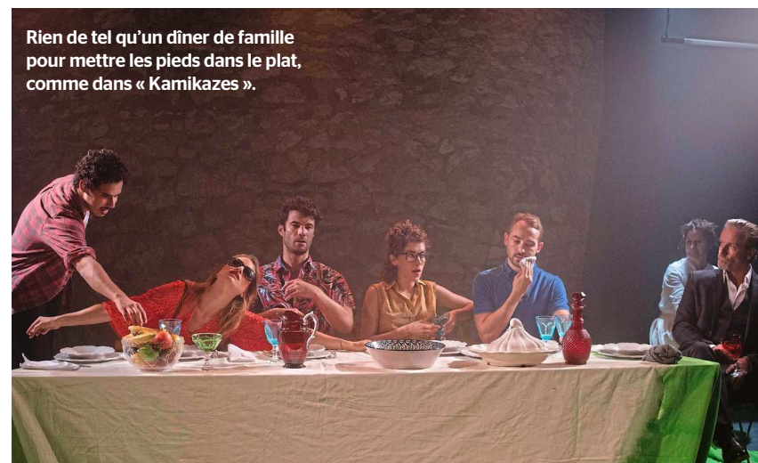
Rien de tel qu'un dîner de famille pour mettre les pieds dans le plat, comme dans « Kamikazes ».

A mi-chemin entre « Festen » et « Huis clos », ce dîner de famille déstructuré déstabilise. S'y racontent des vies en lambeaux,