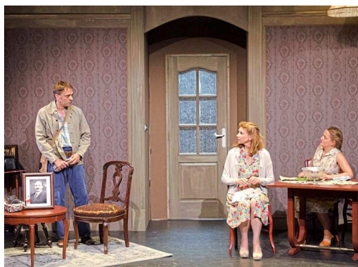
L'amour et la guerre sont les deux mamelles de cette « Suite française ».